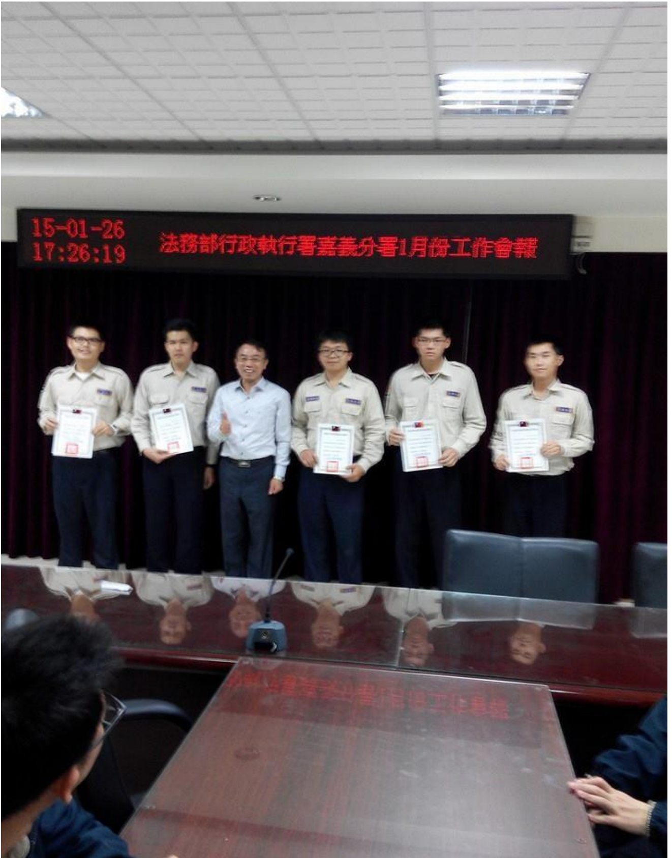
一人戒煙，二人放假