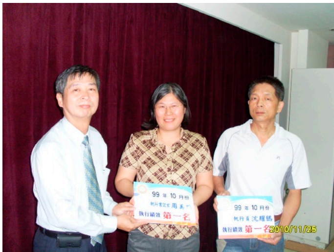
▲榮獲99年10月份執行績效第一名

在一個因緣際會下，參加監獄雇用管理人員考試，於76年10月29日分發到台灣雲林監獄服務擔任管理人員，期間辦理衛生行政工作及人犯保外醫治事項。82年參加「中央暨地方機關公務人員升等考試」政風職系政風科及格，可惜沒有機會擔任政風人員。89年因應法務部行政執行署的成立，參加執行員甄選，90年1月1日轉調至彰化行政執行處擔任執行員，每天從雲林縣斗南鎮到彰化路程遙遠，前後通勤了1年時間，實在是一段不算愉快的經驗。所幸嘉義行政執行處執行員出缺，91年1月4日轉調至嘉義行政執行處，直到102年7月2日自願退休。任職期間，曾於97年、98年及99年連續三年獲得機關執行員績效評比第一名，並於102年7月22日獲行政院頒發貳等服務獎章。